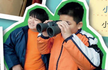
學生們利用望遠鏡觀察濕地上鳥兒的動態。