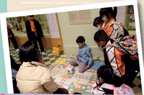
同學們在探知館內認識及試玩昔日的玩具，為他們自行創製玩具作準備。同學們都玩得很開心。