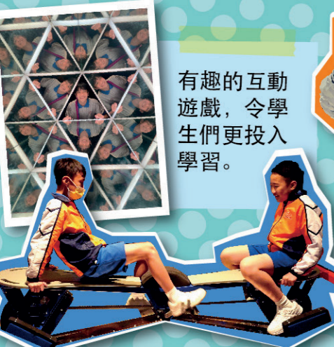
有趣的互動遊戲，令學生們更投入學習。