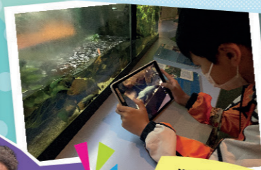
同學認真紀錄所學。