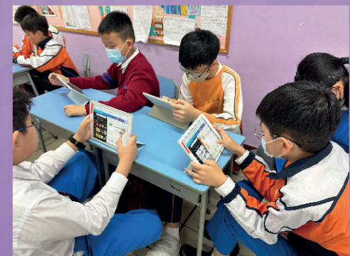
運用紀錄實驗結果