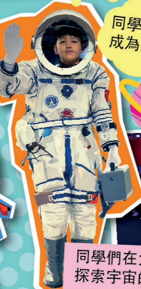
同學們也想成為太空人啊！