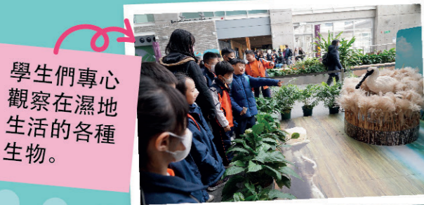
學生們專心觀察在濕地生活的各種生物。