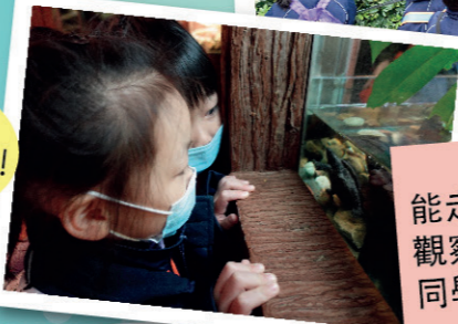
能走出課堂，觀察真實的動物，同學都十分開心。