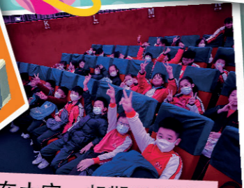
同學們在太空一起觀看電影，探索宇宙的奧秘。